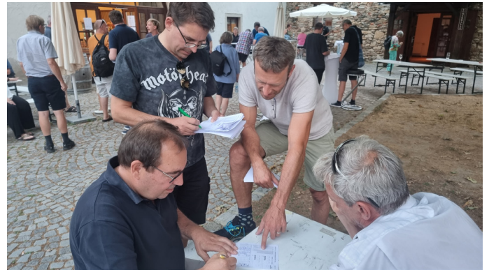
Das siegreiche Team beim Vergleichen der Scores der letzten Runde