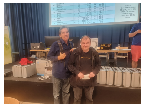
HANDEREK - bei der Preisverteilung leider nur mehr partiell vertreten (3. Platz)